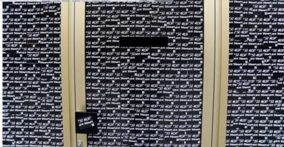
Die Galerie war nicht betretbar..