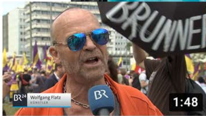
BR - Rundschau - Berlin Demo