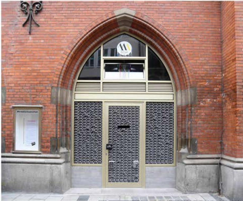
Galerie im Rathaus