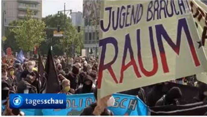
ARD - Tagesschau - Berlin Demo - 11.09.2021