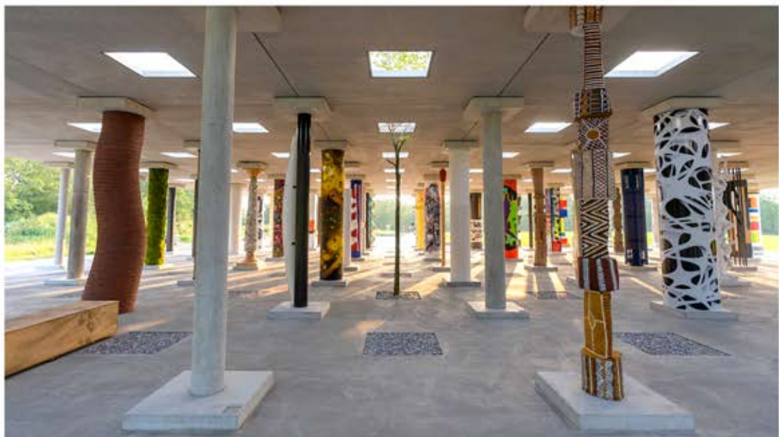
Platane / Permanente Installation in der Säulenhalle Stoa169