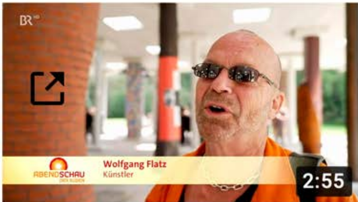
BR - Abendschau - Säulenhalle Stoa169 - 13.09.2021