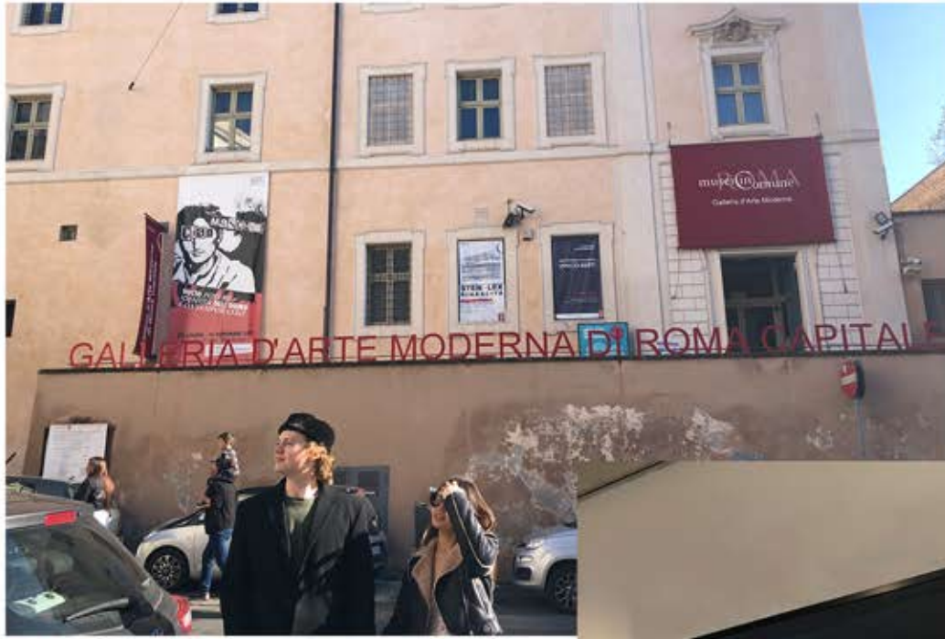
Museum.. Via Francesco Crispi 24.. Rom