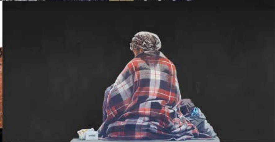
Das Werk konnte nur durch den Sehschlitz in der Tür gesehen werden..